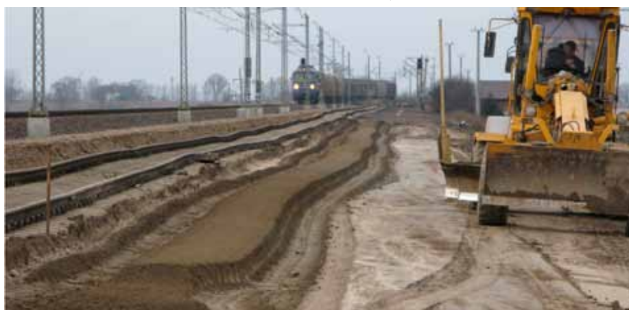
9. Widok gruntu po wymieszaniu ze spoiwem