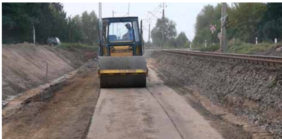
10. Zagęszczanie wykonanej warstwy podłoża