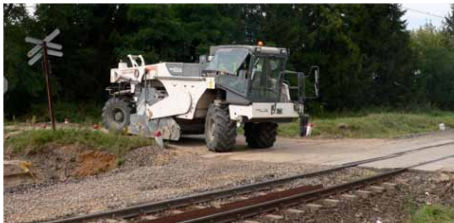
6. Widok sprzętu mieszającego