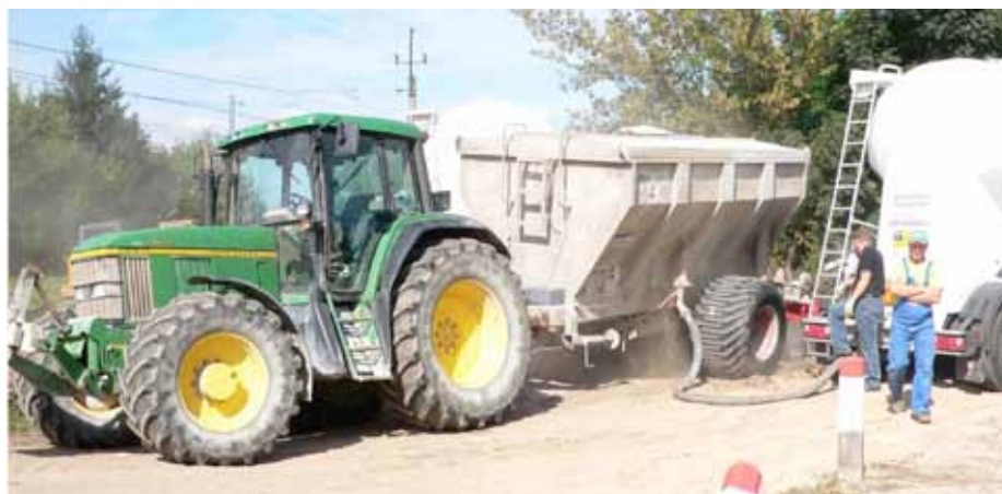
3. Załadunek spoiwa do rozsypywacza