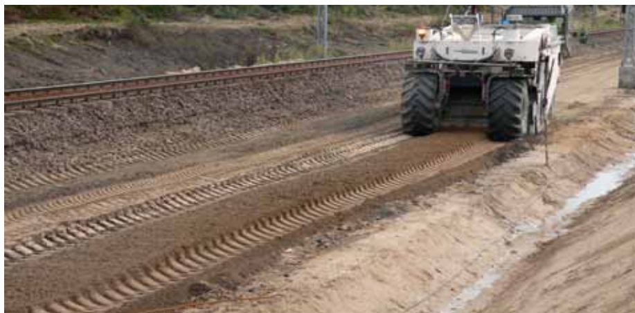
8. Remixer w czasie pracy