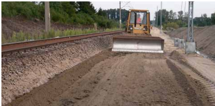
11. Profilowanie wykonanej warstwy podłoża