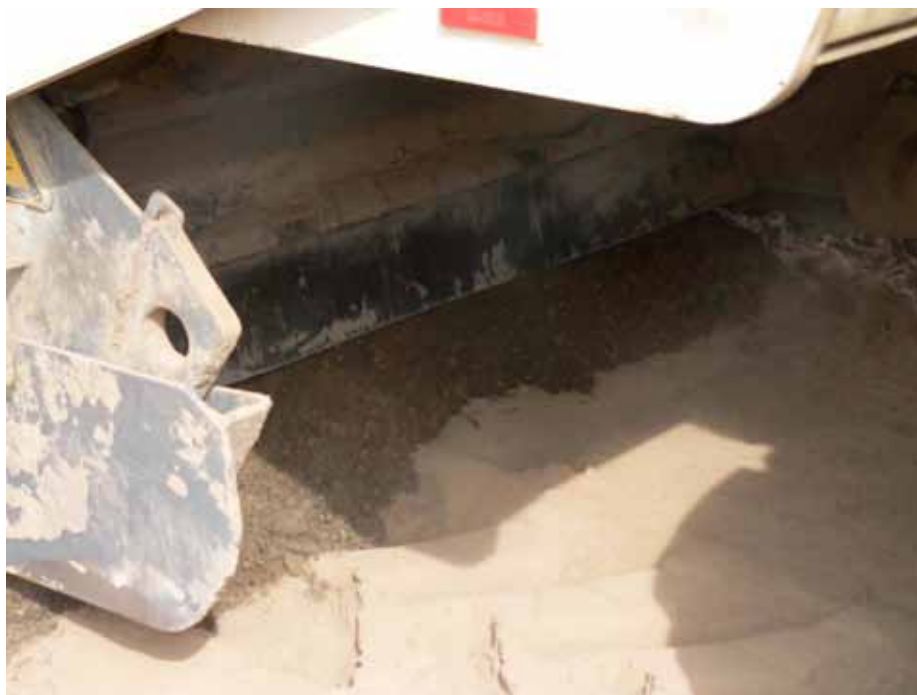
7. Widok mieszalnika w czasie pracy