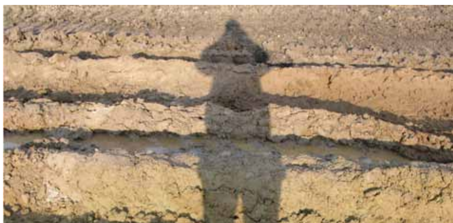
2. Widok gruntu przed stabilizacją