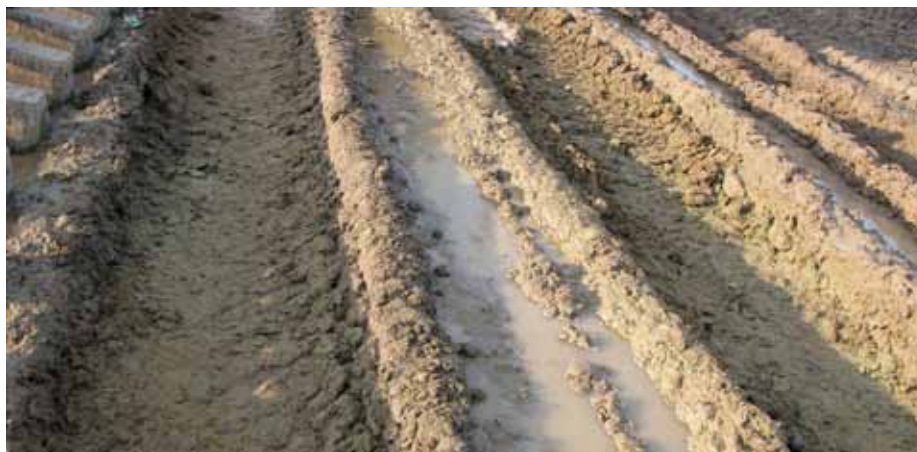
1. Widok gruntu przed stabilizacją

Na odcinku próbnym wykonano następujące sekcje mające pozwolić dobrać odpowiedni sposób wykonania całego zadania: