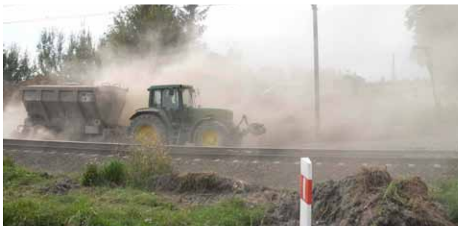
4. Rozkładanie spoiwa Tefra 15