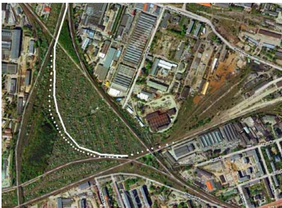
3. Proponowany przebieg łącznicy kolejowej Wrocław Mikołajów – Wrocław Świebodzki (opracowanie własne na bazie mapy podkładowej Zumi.pl)

Proponowana trasa długości rzędu 6 km ma na celu uniknięcie dwukrotnej zmiany kierunku jazdy (w Jaworzynie Śląskiej i w Strzegomiu) składów z rejonu Wałbrzycha na kierunek zachodni lub północny (przez Legnicę), oraz uniknięcia dodatkowej pracy rozrządowej lub manewrowej we Wrocławskim Węźle Kolejowym, np. dla pociągów wiozących w kontenerach węgiel i koks w relacji Wałbrzych Fabryczny - Duisburg i z powrotem, przez przejście graniczne Guben/Gubin [2].