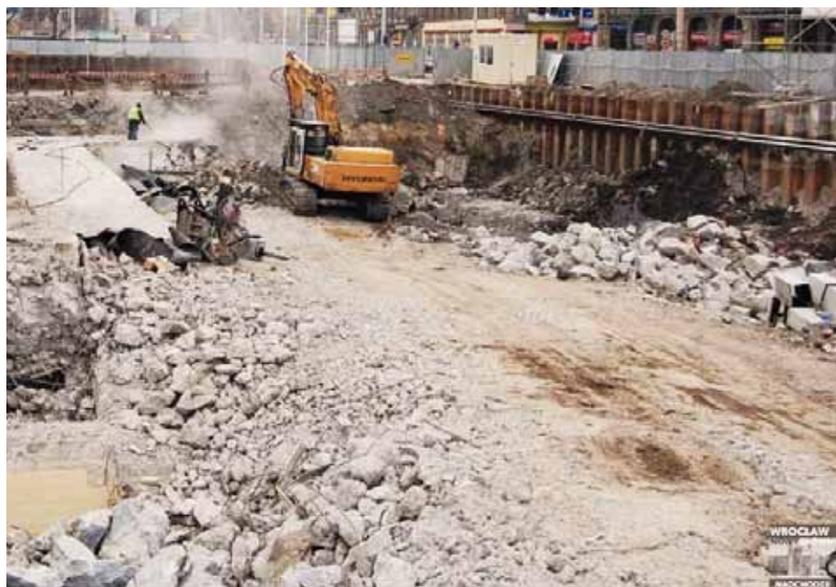
2. Roboty budowlane w obszarze wykopu

Przed remontem istniejące obciążenia z budynku przekazywane były ze stropów za pośrednictwem ścian i słupów, na grunt poprzez ławy i stopy fundamentowe. Na podstawie odkrywek ław i stóp fundamentowych określono rzędne posadowienia budynku na -1,91÷-4,30 m budynku oraz grubość ław fundamentowych w przedziale 70÷170 cm. Fundamenty budynku głównego dworca zostały wykonane z kamienia granitowego, oraz cegły o wytrzymałości na ściskanie 16,49 MPa i zaprawy wapiennej marki M0,6. Wyniki badań geologicznych wskazały, że budynek Dworca Głównego na przeważającym obszarze posadowiony jest na gruncie określonym jako słaby, miejscowo niebudowlany. Problem dotyczył wszystkich odkrytych stóp i większości ław fundamentowych. Natomiast przy zakładanych dodatkowych, nowoprojektowanych obciążeniach nastąpiłaby przekroczenie nośności podłoża gruntowego, więc niezbędne okazało się wzmocnienie gruntu poprzez zastosowanie pali wykonanych w technologii iniekcji strumieniowej „Jet-Grouting”.