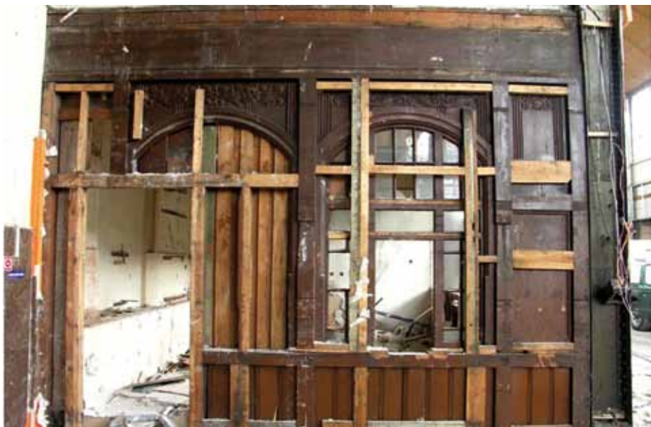
11. Secesyjne witryny w hali kasowej

W wyniku badań stratygraficznych ustalono, iż pierwotnie budynek dworca posiadał barwę ciemno-ugrową (ciemnopomarańczową) – pozostałości tego koloru odnaleziono zarówno na detalu, jak i na tynku. ◀