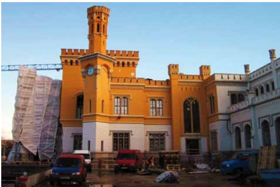
12. Elewacje neogotyckiego budynku dworca (1856)