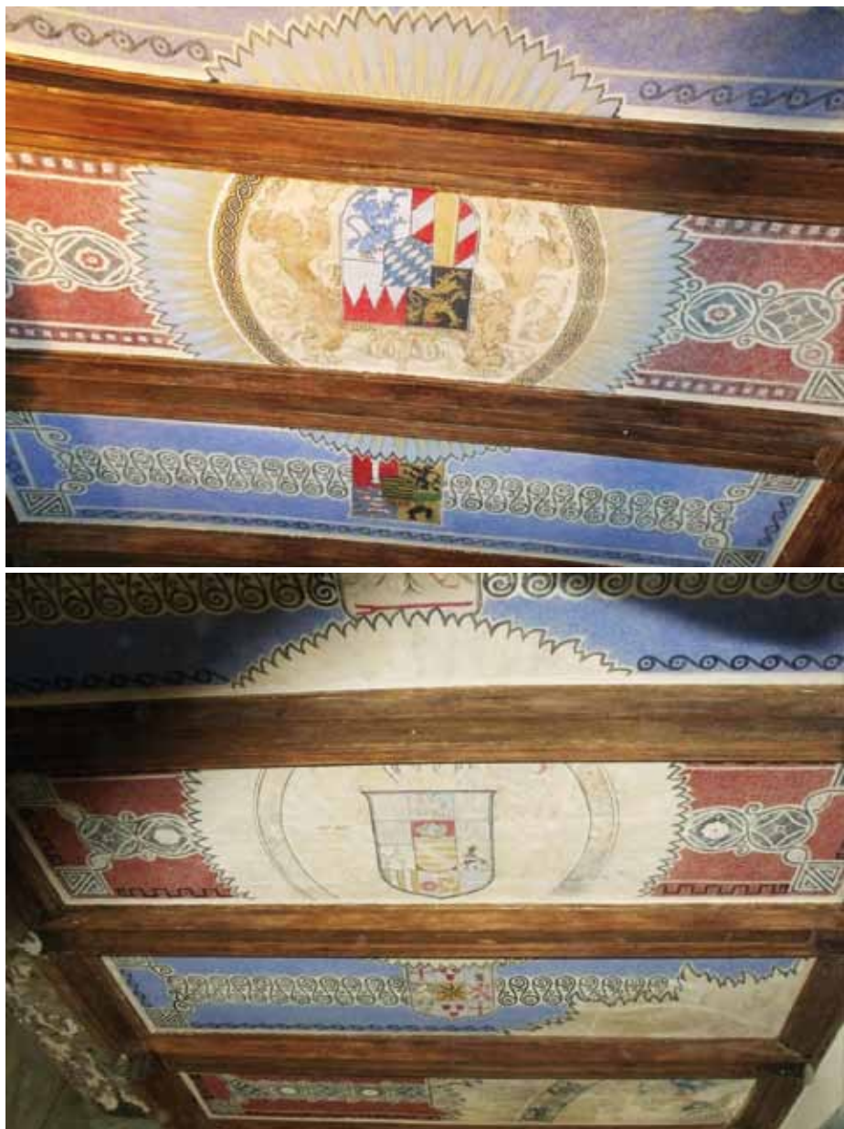
6. Belkowy strop z dekoracją malarską z herbami prowincji pruskich

Strop zwraca uwagę rozbudowaną, ażurową formą. Całość posadowiona jest