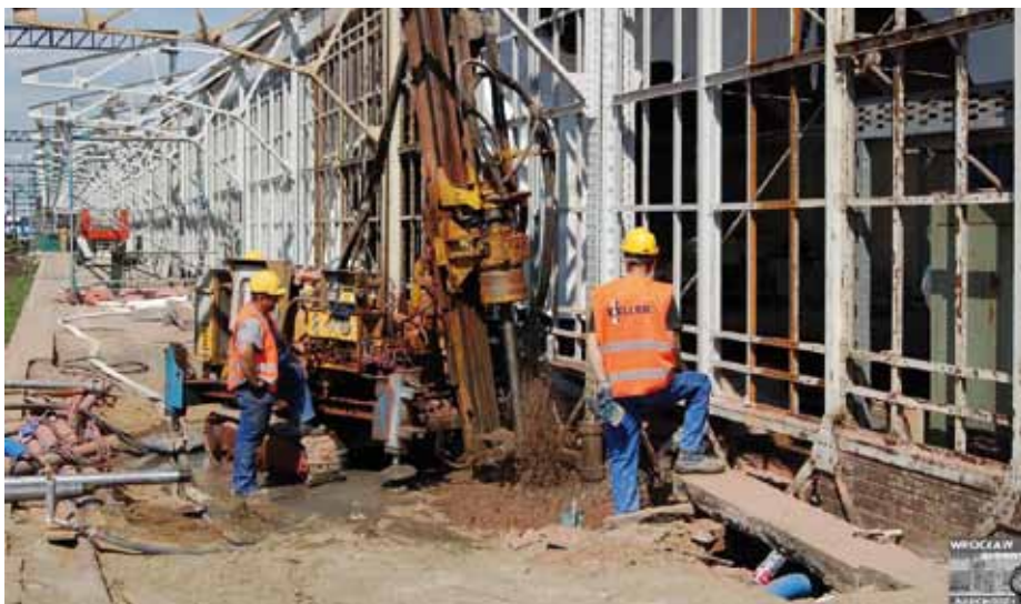
4. Roboty wzmocniające podłoże gruntowe