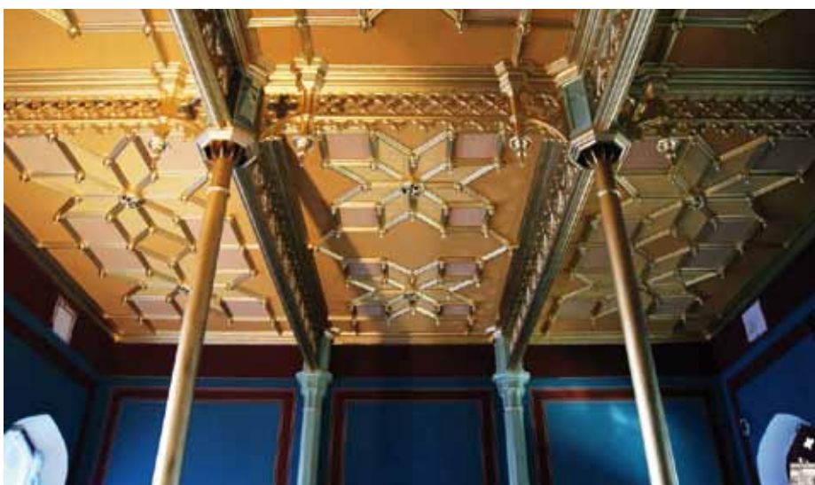
9. Stropy w dawnej poczekalni pierwszej i drugiej klasy w łączniku wschodnim