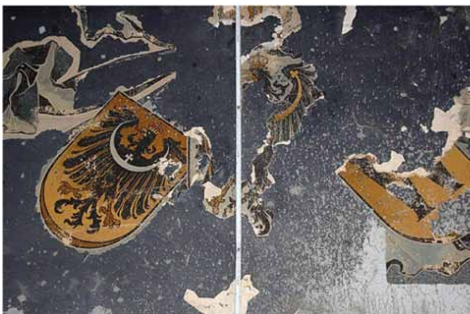
5. Malowane dekoracje floralno-heraldyczne w pomieszczeniach pierwszej kondygnacji ryzalitu wschodniego

Metoda iniekcji strumieniowej polega na wykonaniu w gruncie zespolonej bryły cementowo - gruntowej. Przed przekształceniem w cemento-grunt grunt zostaje rozluźniony za pomocą silnego i skoncentrowanego strumienia wody lub zaczynu cementowego, często dodatkowo otulonego sprężonym powietrzem, o prędkości wylotowej przy dyszy ponad 100 m/s (ciśnienie strumienia do 400 bar). Rozluźniony grunt zostaje wymieszany z zaczynem cementowym, a nadwyżka mieszaniny wypływa na powierzchnię wzdłuż żerdzi wiertniczej. Zasięg oddziaływania strumienia tnącego zależy od rodzaju gruntu oraz zastosowanego wariantu technologii. Kontrolując w precyzyjny sposób ruch rury wiertniczej (prędkość podciągania i obrót) uzyskuje się pożądaną kształt i zasięg zeskalania.