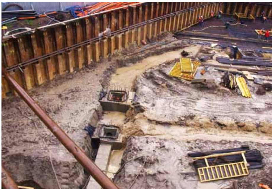
1. Zabezpieczenie wykopu pod garaż podziemny

Bezpośrednio pod powierzchnią terenu zalega warstwa nasypów antropogenicznych piaszczysto-gliniastych z domieszką gruzu i żuźla o miąższości do 3,5 m. Poniżej występują gliny zwałowe, głównie w postaci glin piaszczystych zwięzłych lokalnie z przewarstwieniami piaszczystymi. Woda