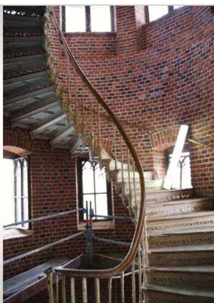
10. Żeliwna klatka schodowa w wieży wschodniej przy ryzalicie wschodnim

na wspornikach, z wypełnieniem z motywem trójliścia i stalaktytowymi zwornikami. W partii stropu na ścianach znajduje się fryz arkadkowy, z arkadami zamkniętymi łukiem Tudorów. Kasetony umieszczone są w profilowanych ramach. Niestety, większość z nich jest wtórna, oprócz czterech pól przy narożnikach – ażurowych, metalowych z motywem rozety. Bezpośrednio pod fasetą znajduje się płaskorzeźbiony, gipsowy fryz z motywem wici roślinnej oplatającej rozety, dzielony małymi, cynkowymi, profilowanymi zwornikami, z dekoracją w formie szyszki.