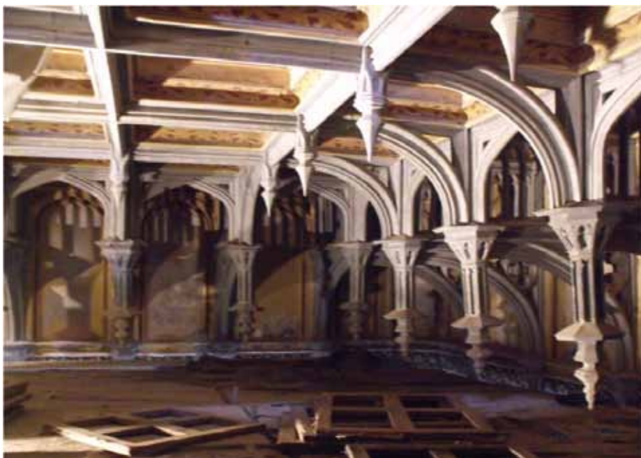
8. Stropy z rozbudowaną formą ażurową