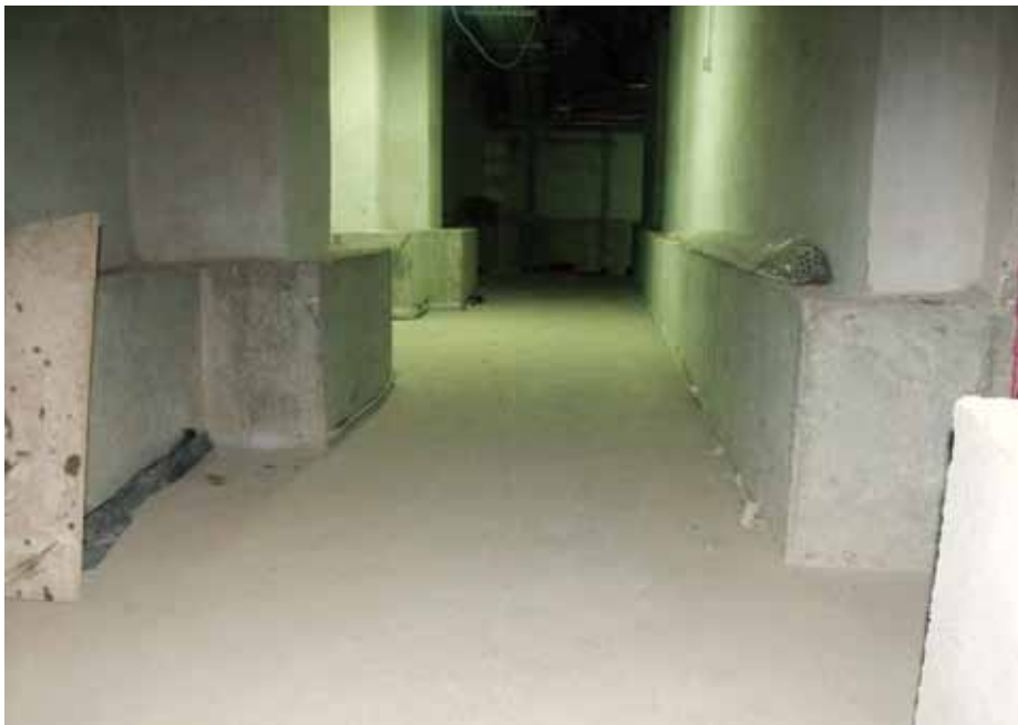
3. Piwnice budynku dworca