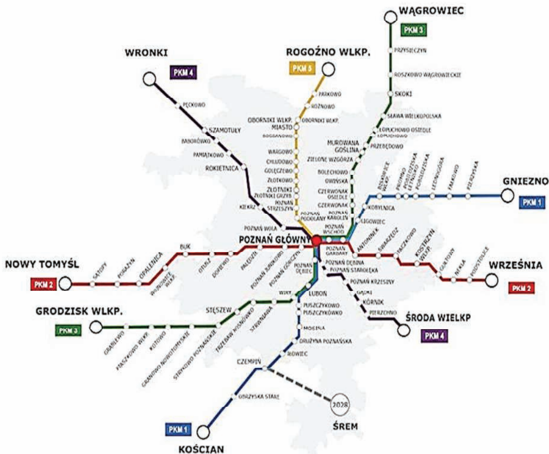
2. Stacje i przystanki osobowe na liniach PKM.

Zakwalifikowanie wszystkich projektów zgłoszonych przez Samorząd